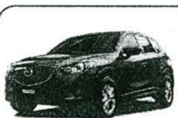
Mazda CX-5 2016

SI INMERTES A PLAZO A TRAVES DE TU CUENTA UNICA, TENDRAS ACCESO A UNA LINEA DE PROTECCION PARA EMERGENCIAS DE HASTA EL 80% DEL MONTO DE TU INMERSION. PREGUNTA A TU EJECUTIVO.