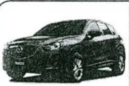
Mazda CX-5 2016

SI INVIERTES A PLAZO A TRAVES DE TU CUENTA UNICA, TENDRAS ACCESO A UNA LINEA DE PROTECCION PARA EMERGENCIAS DE HASTA EL 80% DEL MONTO DE TU INVERSION. PREGUNTA A TU EJECUTIVO.